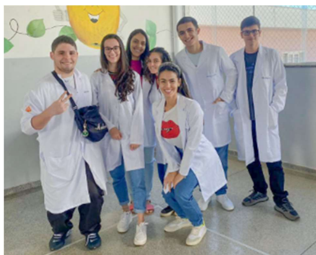
Figura 5 - Acadêmicos do curso de medicina da Faculdade Atenas em Passos-MG