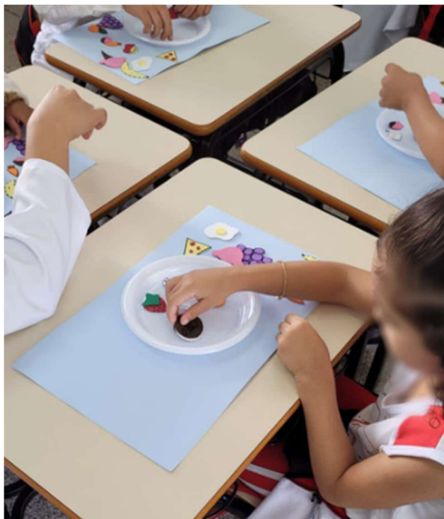
Figura 1 - Criança do CEMEI Professora Maria Gomes de Vasconcelos Marino montando seu prato saudável.