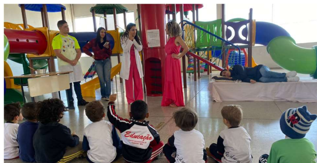
Figura 4- Acadêmicos do curso de medicina da Faculdade Atenas em Passos-MG, em atividades lúdicas com os alunos.