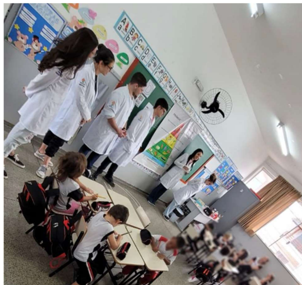
Figura 3 - Acadêmicos do curso de medicina da Faculdade Atenas em Passos-MG, em atividades lúdicas com os alunos sobre os grupos alimentares.