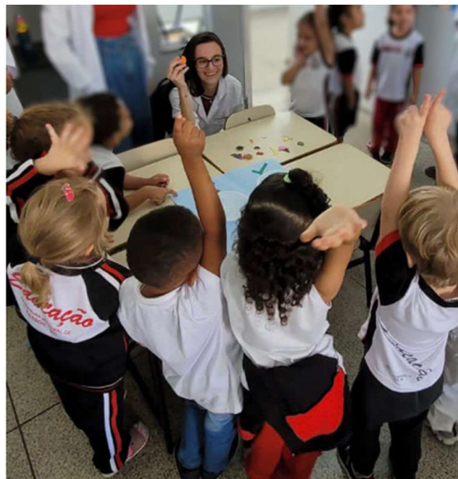
Figura 2 – Acadêmicos de medicina da Faculdade Atenas em Passos-MG realizando uma atividade centrada na identificação das características de uma refeição saudável.