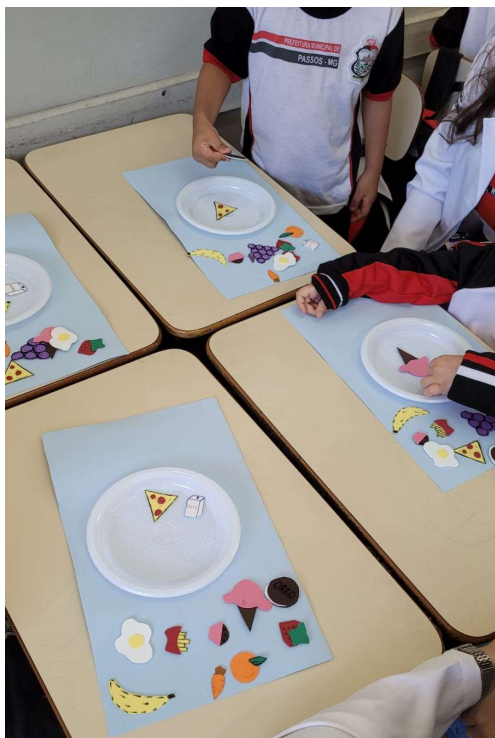
Figura 6- Ilustração dos grupos alimentares confeccionados em EVA pelos acadêmicos